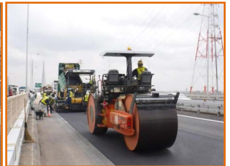
【アスファルト舗装施工状況※】