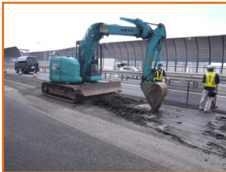
【アスファルト舗装はぎ取り状況※】