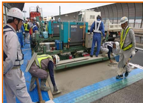
【鋼繊維補強コンクリート打設状況※】