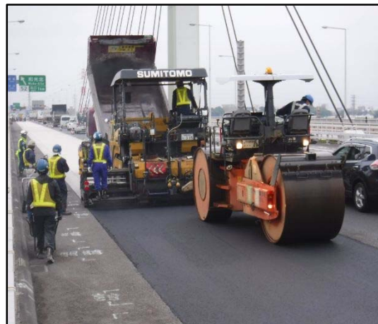
【アスファルト舗装施工状況】