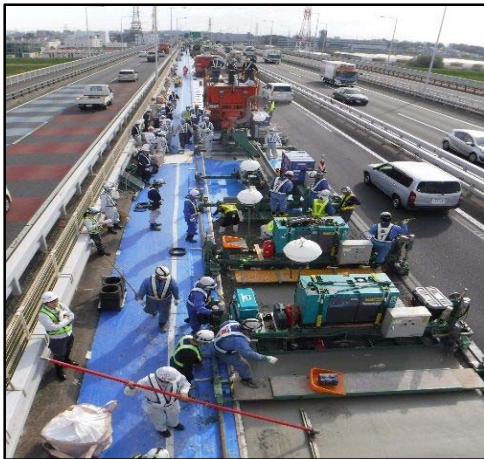
【鋼繊維補強コンクリート施工状況】