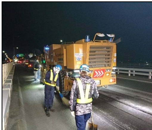
【アスファルト舗装切削状況】