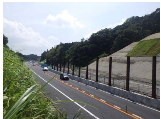
落石防護柵の撤去後