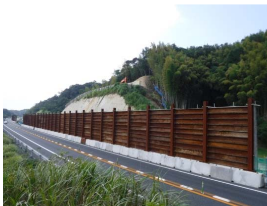
落石防護柵の撤去前

館山自動車道(君津～富津竹岡)の4車線化工事に伴い、供用路線の安全対策のために設置した落石防護柵及び仮設ガードレール・目隠しネットは、工事進捗に併せ一部撤去を行います。