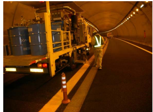
路面標示工の設置