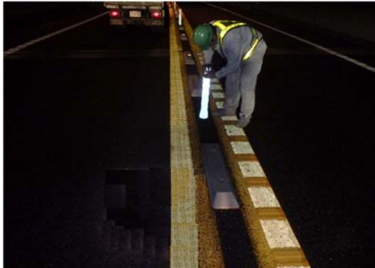
車線分離標取替工