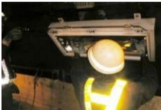
トンネル照明設備清掃・点検