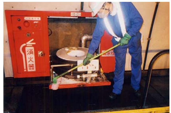
非常用設備清掃・点検