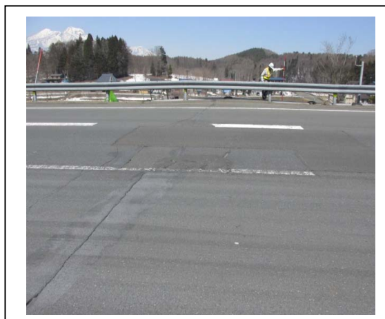
【舗装路面の損傷状況】