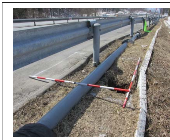
【本線盛土の変状状況】