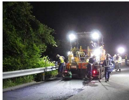
ランプ 舗装補修工事