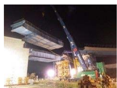
SICランプ橋架設工事