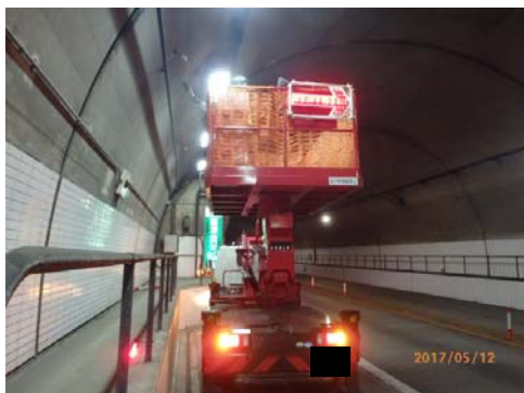
ラジオ再放送誘導線の清掃

お客さまに安全・快適に高速道路をご利用いただくため、ご理解とご協力をお願いします。