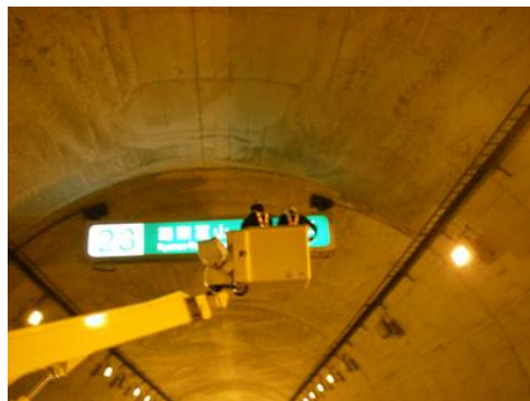
トンネル内構造物の点検・清掃