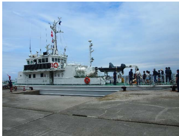
【船の見学(イメージ)】