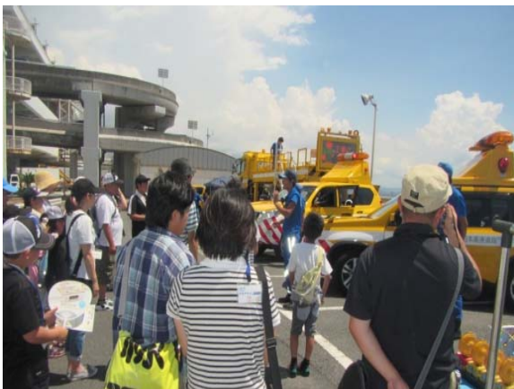
【道路パトロールカーの体験試乗】