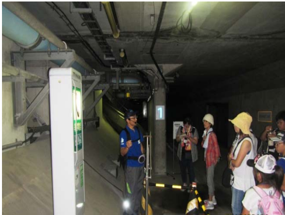
【アクアトンネル：緊急避難通路探検】