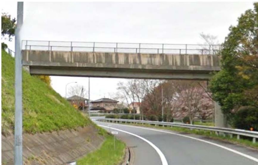
谷田部IC横断歩道橋

工事箇所は1車線であり、工事をしながらの通行帯の確保が困難なため、お客さまへの影響が極力少なくなるよう、交通量の少ない平日の夜間に閉鎖を行い、工事を集中的かつ効率的に実施します。安全・快適に高速道路をご利用いただくために必要な工事ですので、ご理解とご協力をお願いします。