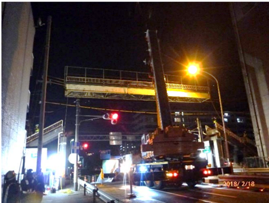
撤去工事作業状況例