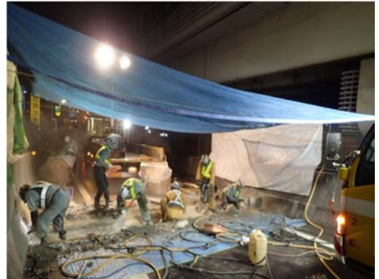
取替工事作業状況