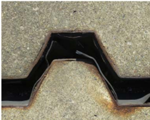
伸縮装置損傷状況

橋と橋の繋ぎ目に設置されている伸縮装置が経年劣化により損傷し、表面のゴムの剥れや鉄板の露出、ボルトの錆などが発生しているため、より耐久性の高い鋼製の伸縮装置への取替工事を実施します。工事箇所は1車線であり、工事をしながらの通行帯の確保が困難なため、ランプを閉鎖して作業を行う必要があります。そのため、お客さまへ極力ご迷惑をおかけしないよう、交通量が少ない平日の夜間にランプ閉鎖を行い、工事を集中的かつ効率的に実施します。安全・快適に高速道路をご利用いただくために必要な工事ですので、ご理解とご協力をお願いします。