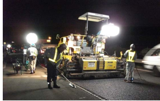
舗装補修工事 作業状況写真