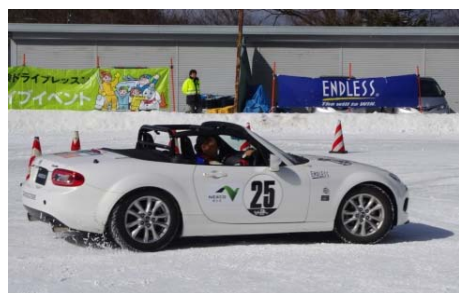
【雪道試乗体験：スタッドレスタイヤとノーマルタイヤの比較】