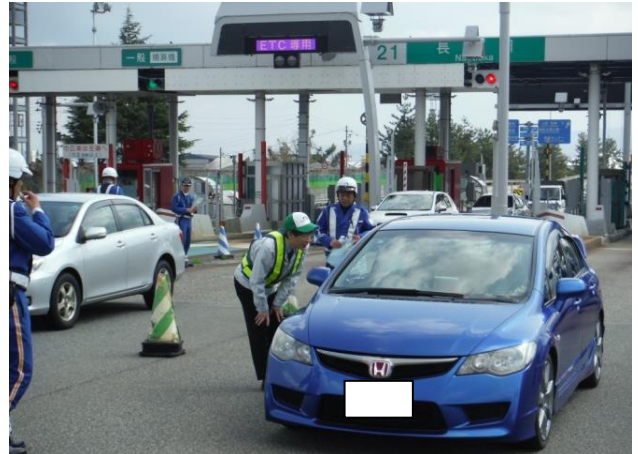
社員による交通安全啓発