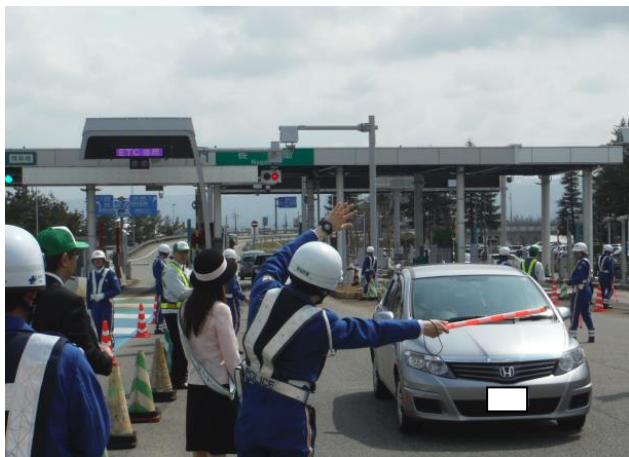
関係機関と合同で安全啓発