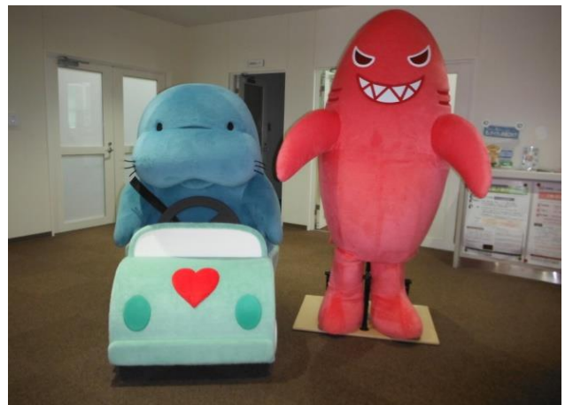
マナーティ(左)・イカンザメ(右)