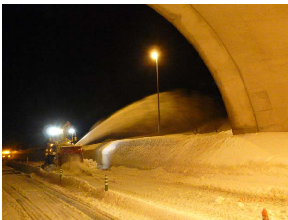
< 昨年のトンネル坑口部除雪状況 >