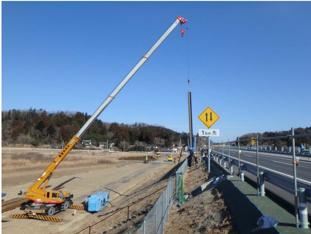
施工イメージ写真