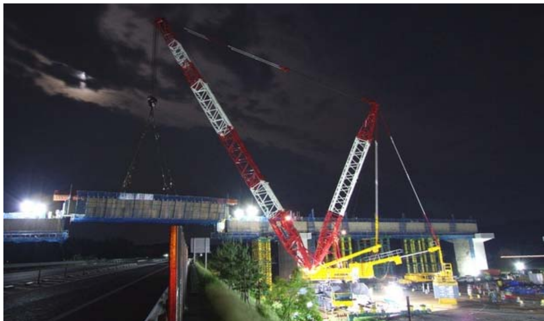
《橋りょう架設イメージ》