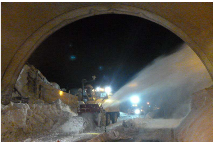
< 昨年のトンネル坑口部除雪状況 >