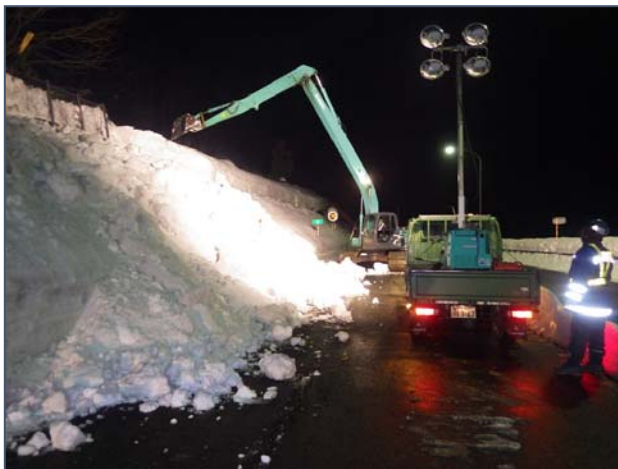
<H30の本線脇斜面の除雪状況>