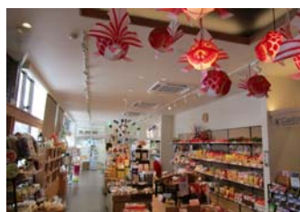
リンゴジュース ※フードコートでも販売

青森県産のりんごを使用したジュース、伝統工芸「こぎん刺し」、りんごのお菓子など、青森の逸品を取り揃えています。