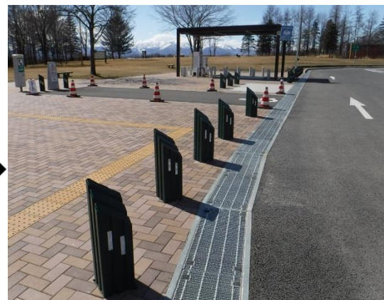
工事完了後(イメージ)