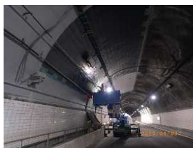
トンネル覆工補強