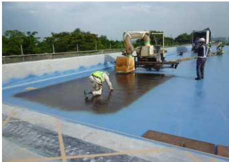
高性能床版防水工