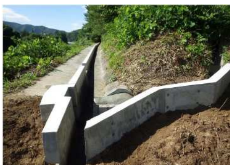
跳水対策 (排水溝の嵩上げ)