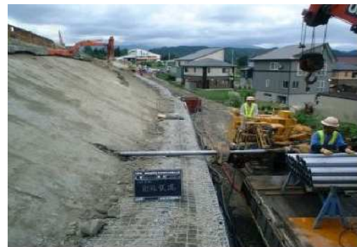
盛土内浸透水排除対策 (水抜きボーリング)