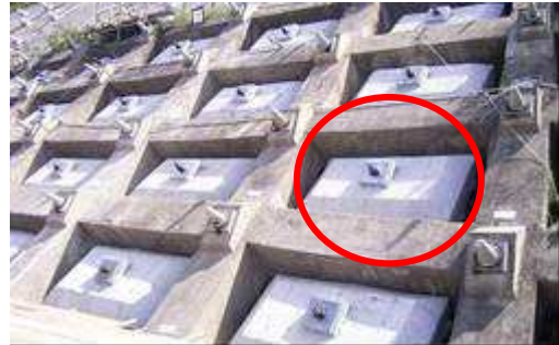
グラウンドアンカー