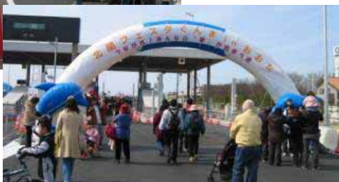
共同開催したイベント