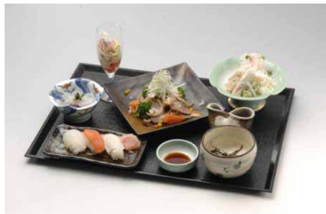
上信越道 横川SA 群馬県産品(こんにゃく、きのこ等) を使用したレストランメニュー