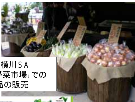
上信越道 横川SA 「E NEXCO 野菜市場」での 群馬県産品の販売

NEXCO東日本の通販サイト『ドラぷらSHOPPING』で群馬県産品の品揃えを充実