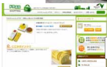
『ドラぷら』での群 馬県産品の販売