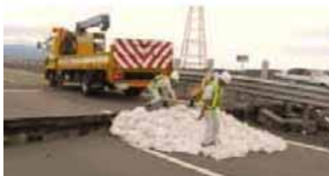
災害時の応急復旧