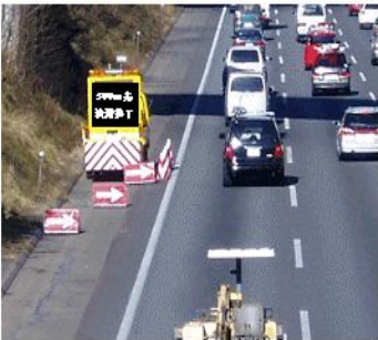
①「渋滞終了」をお知らせする表示