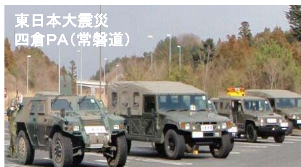
災害派遣部隊の進出拠点として活用