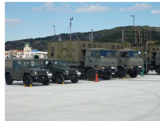
高速道路施設を活用した実動訓練