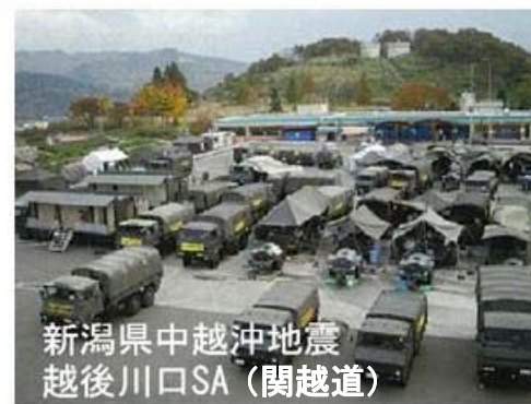
災害派遣部隊指揮所展開