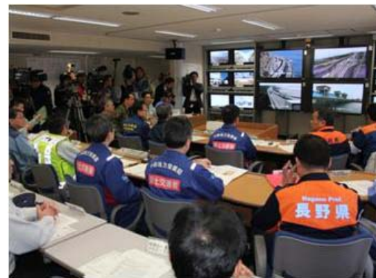
関係機関と連携した実動訓練