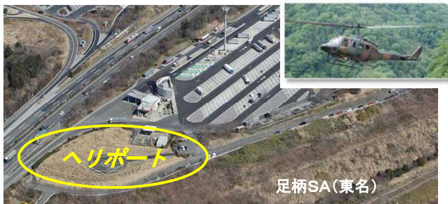
場外離発着場(ヘリポート)の活用