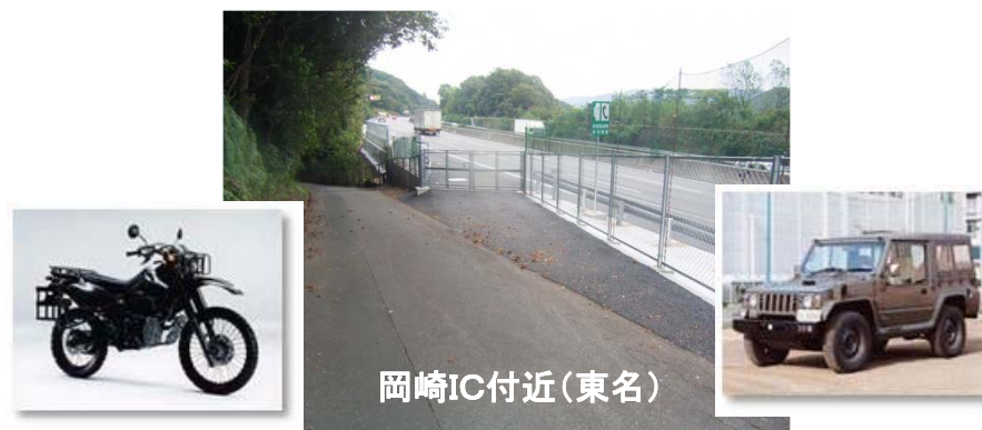
緊急開口部の活用