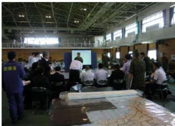
関係機関と連携した図上訓練

災害発生時に備え、平常時から災害対応の課題を共有し、相互の役割などを継続的に双方で確認し、適宜災害時の協力連携内容の見直しを行う