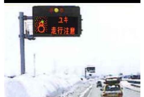
情報板による注意喚起

このような路面では『急』の付く運転(急ハンドル、急加速、急ブレーキ)は大変危険です。 速度を控えめに、十分な車間距離 をとって安全運転を心掛けてください。