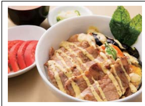
那須豚の焼肉どん(税込 900 円) 東北自動車道 那須高原SA(上り線)