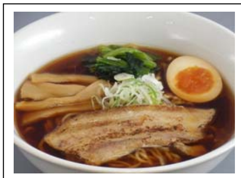
炙り麦豚ラーメン(税込 700 円) 上信越自動車道 横川SA(下り線)