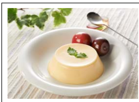
黄金桃プリン(税込 1,296 円) 北陸自動車道 黒埼PA(上り線)