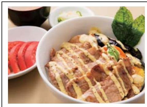
那須豚の焼肉どん(税込 900 円) 東北自動車道 那須高原SA(上り線)