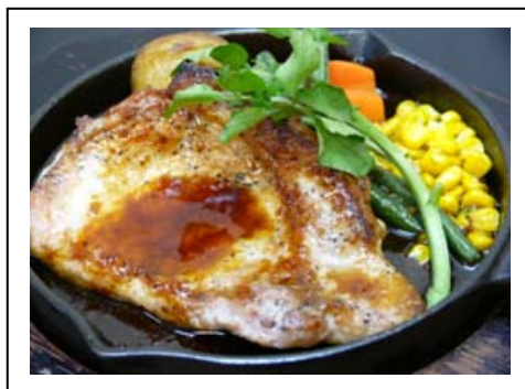
上州麦豚ポークソテー(税込 1,500 円) 関越自動車道 赤城高原SA(上り線)