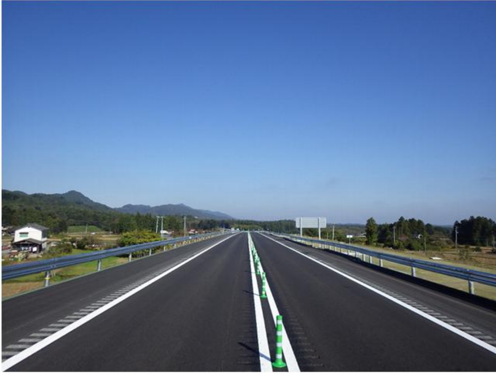
相馬～新地間 仙台方向を望む