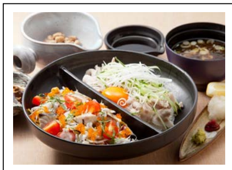
“二代目”茨城VICTORY丼(税込 1,240 円) 常磐自動車道 友部SA(上り線)