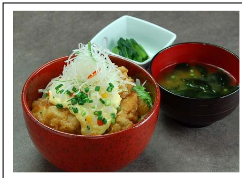
赤城鶏のタルタル親子(税込 880 円) 上信越自動車道 横川SA(上り線)