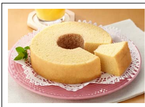
樹楽里ライスバウム(税込 1,220 円) 東北自動車道 安達太良SA(上り線)