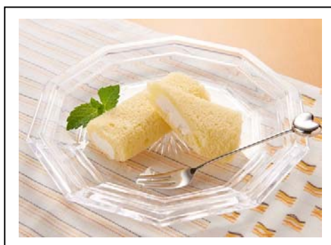
小樽ロール(税込 1,188 円) 札樽自動車道 金山PA(上下線)