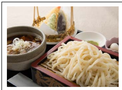
けんちん水沢うどん(税込 1,180 円) 関越自動車道 上里SA(上り線)