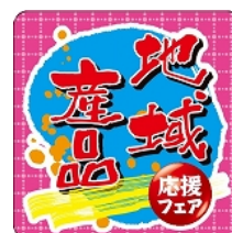
〈地域産品応援シール〉

なお、専用用紙は、各SA・PAにて入手、または当社ホームページ「ドラぶら」から ダウンロードすることができます。