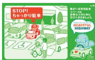
障がいをお持ちの方や妊婦さんのためのスペースです。 本当に必要な方のために空けておきましょう。