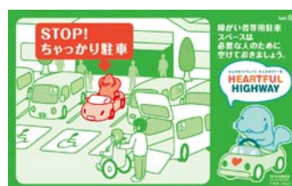
障がいをお持ちの方や妊婦さんのためのスペースです。 本当に必要な方のために空けておきましょう。