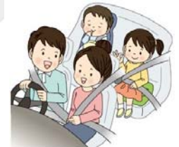
チャイルドシートも忘れずに！

高速道路等の死亡事故で後部座席同乗者の死亡者のうち約7割がシートベルト非着用。全席着用義務となっていますので、後部座席同乗者も必ずシートベルトを着用しましょう！