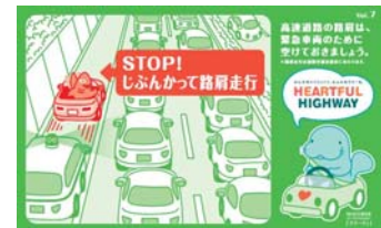
路肩は緊急車両のために 空けておきましょう！