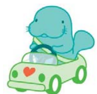
マナーアップキャラクター 「マナーティ」