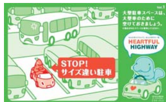
自分の車のサイズに合った 駐車マスに停めましょう！