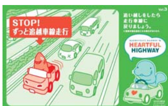
追い越し後は後方確認をおこない、 走行車線に戻りましょう！