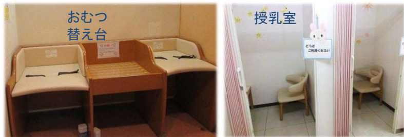
ベビーコーナーにはおむつ替え台や、授乳室などを設置