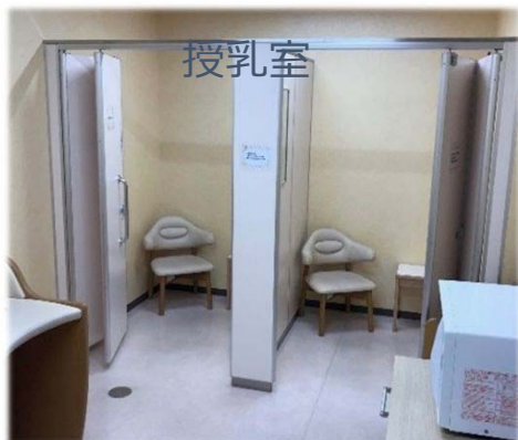
【24時間ご利用可能なベビーコーナー】