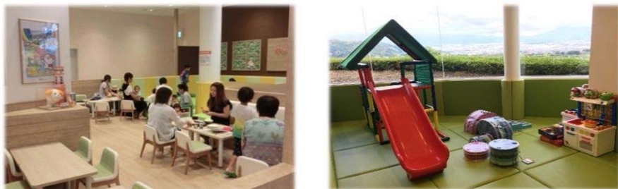
フードコート内に背の低いテーブルやイス、プレイスペースなどを設置