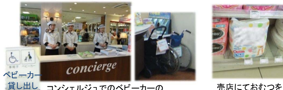
コンシェルジュでのベビーカーの無料貸し出しサービス