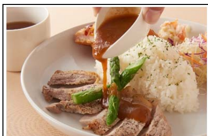
姫豚のポークソテープレート (1,080 円)