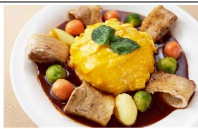
“倭国三元豚武蔵”の 太陽オムライス (1,200 円)