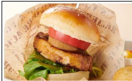
とん(豚)でもないバーガープレート ～人目を気にせず喰らいつけ!～ (1,200 円)