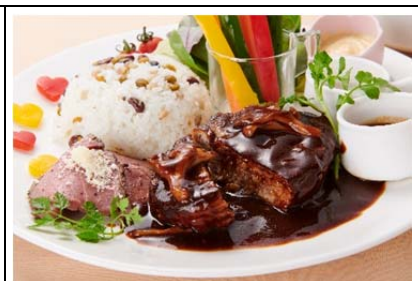
上里庭園 彩の一皿 (1,200 円)