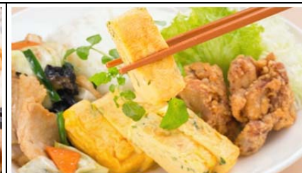
おふくろの元気ごはん (980 円)