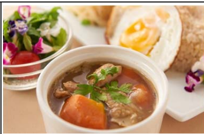
茨城食材のアジアンプレート (1,200 円)