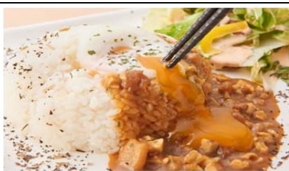
奥久慈しゃものアンサンブル ～調和～ (1,200 円)