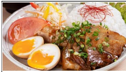
杜仲豚のコーロー飯 (900 円)