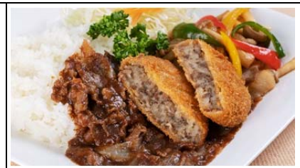
かつの牛と桃豚のペアプレート (1,100 円)