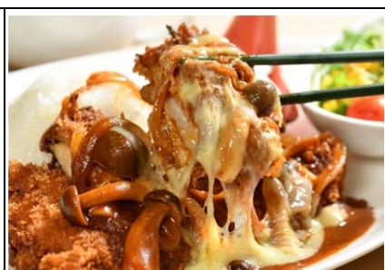
おばすて棚田ご飯 (1,150 円)