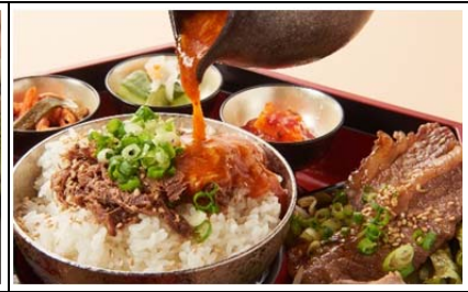
～五味五色～ トラジ守谷プレート (1,200 円)