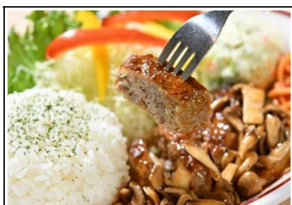
信州きのこ ジューシーハンバーグプレート (1,100 円)