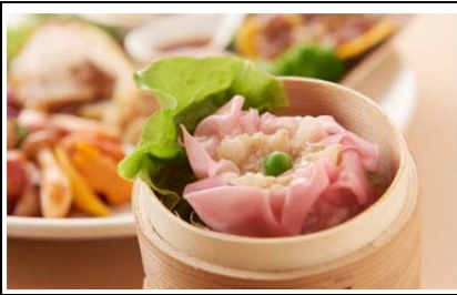
チャイニーズダイニング Moriya 肉と野菜の おもてなし (1,200 円)