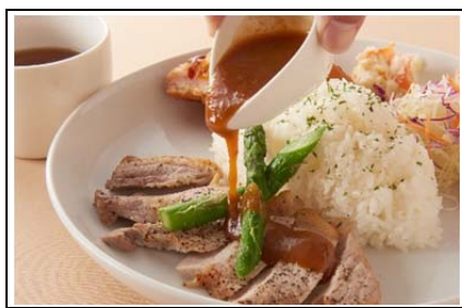
姫豚のポークソテープレート (1,080 円)