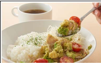
味麗豚とアボカドの わさびマヨ炒めごはん (850 円)