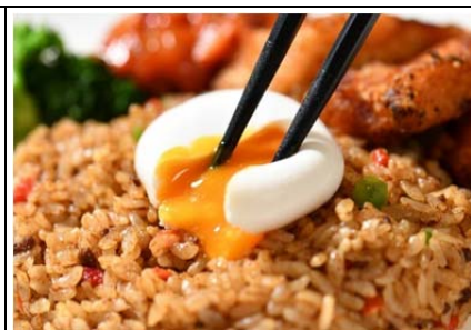
信州ハーブ鶏の 色鶏(彩り)プレート (1,200 円)