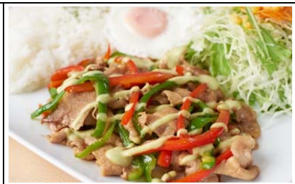
わさびソースで食べる 彩の黒豚焼き肉プレート (980 円)