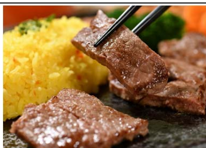
ステーキスタミナもり盛りプレート (1,200 円)