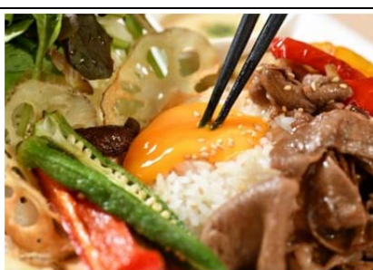
おぶせキッチンプレート (1,200 円)