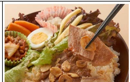
ローズポークのスタミナプレート (950 円)