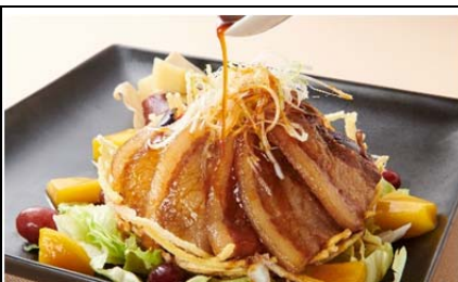
彩り野菜と埼玉県産ポークの 角煮ディッシュ (1,200 円)