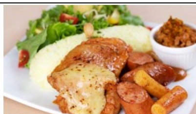
紫波 de チーズタッカルビ ムーチョ (1,200 円)