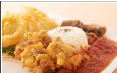
チキチキワンプレート (1,000 円)