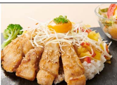
上州麦豚ライスプレート (1,200 円)