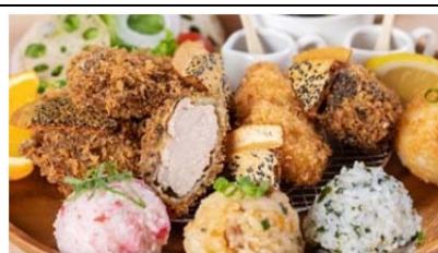
南部巖手のヒレカツプレート (1,200 円)