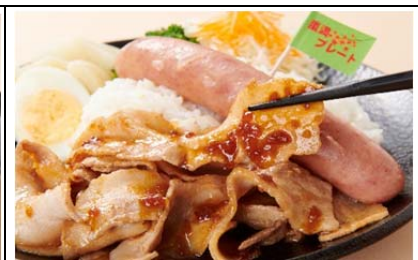
嵐満プレート (1,200 円)