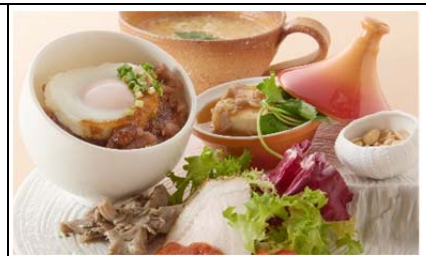
茨城にメロメロ～素晴らしき 茨城の“食”に愛を込めて～ (1,200 円)