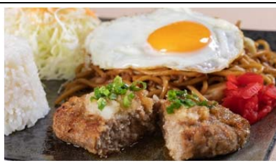
錦秋湖ハンバーグセット (980 円)