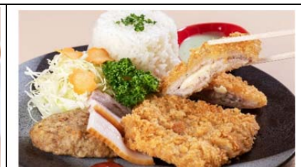
岩手山麓満点ディッシュ (1,200 円)