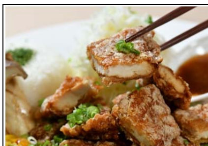
彩鶏どり山賊揚げプレート (1,200 円)