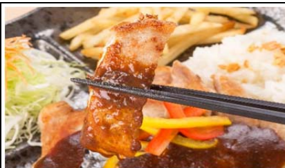
すずし豚とんテキ定食 (950 円)