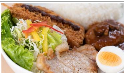
もりおかあじわい林檎ポークの 元気ランチ (1,080 円)