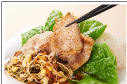
巻いて食べよう武州豚プレート (1,150 円)