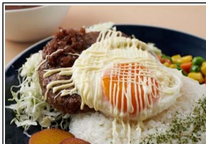
鹿肉 de ロコモコ (1,080 円)