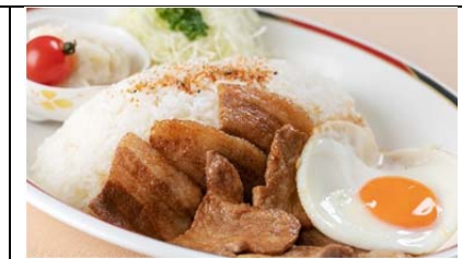
龍泉洞黒豚プレート (800 円)