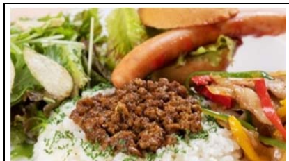
白ゆりポーク生姜焼き& キーマカレー (980 円)