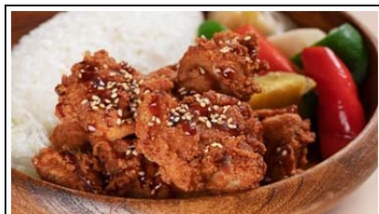
みちのく清流味わいどり 満足プレート (1,000 円)