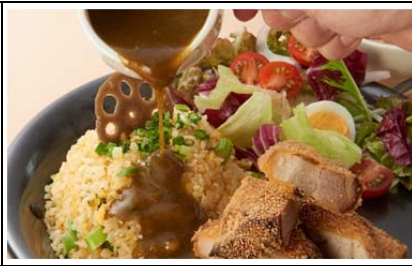
つくば美豚のやわらか角煮かつ Chinese Plate (1,200 円)