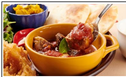
とろける彩さい牛のトマト煮込みと もちりナンのプレート (1,200 円)