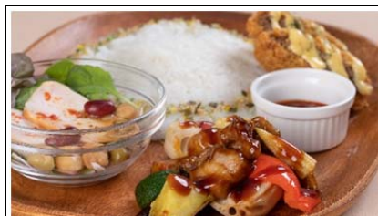
いわて気まぐれプレート (1,180 円)