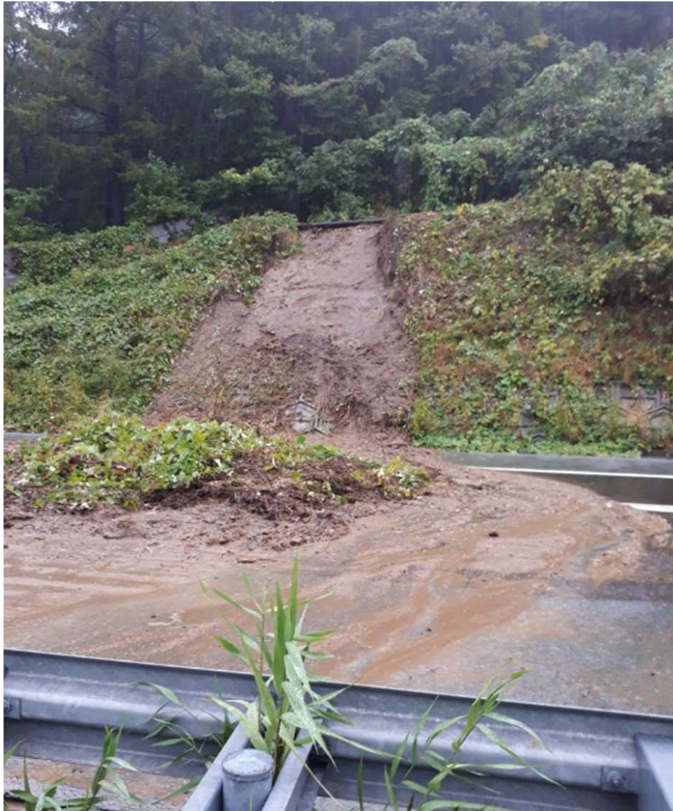
上信越道(佐久IC~小諸IC)