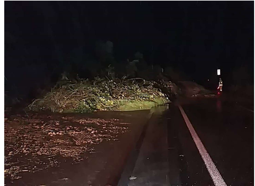
東北道(白河中央スマートIC)