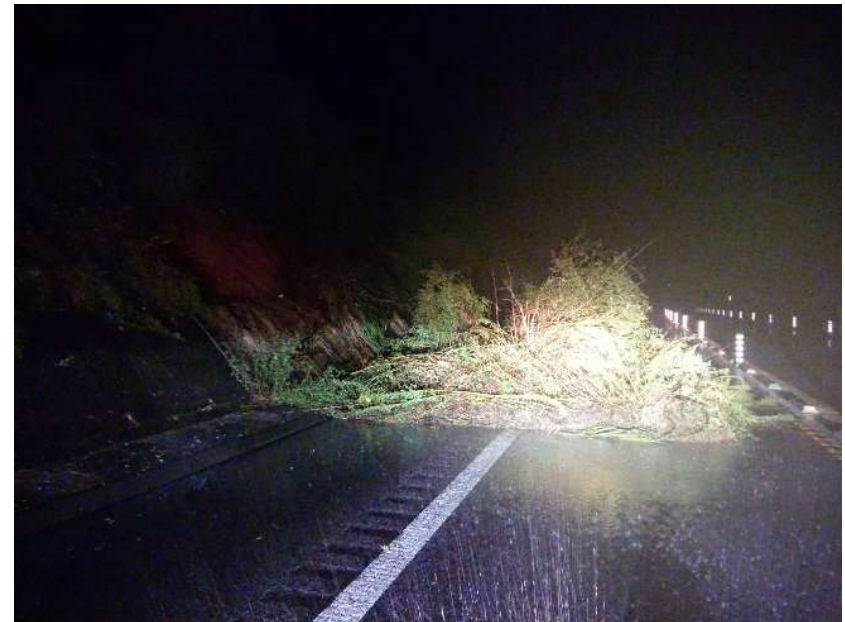
常磐道(常磐富岡IC~浪江IC)