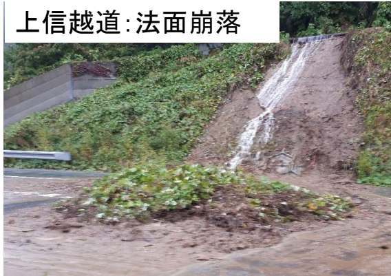
上信越道: 法面崩落