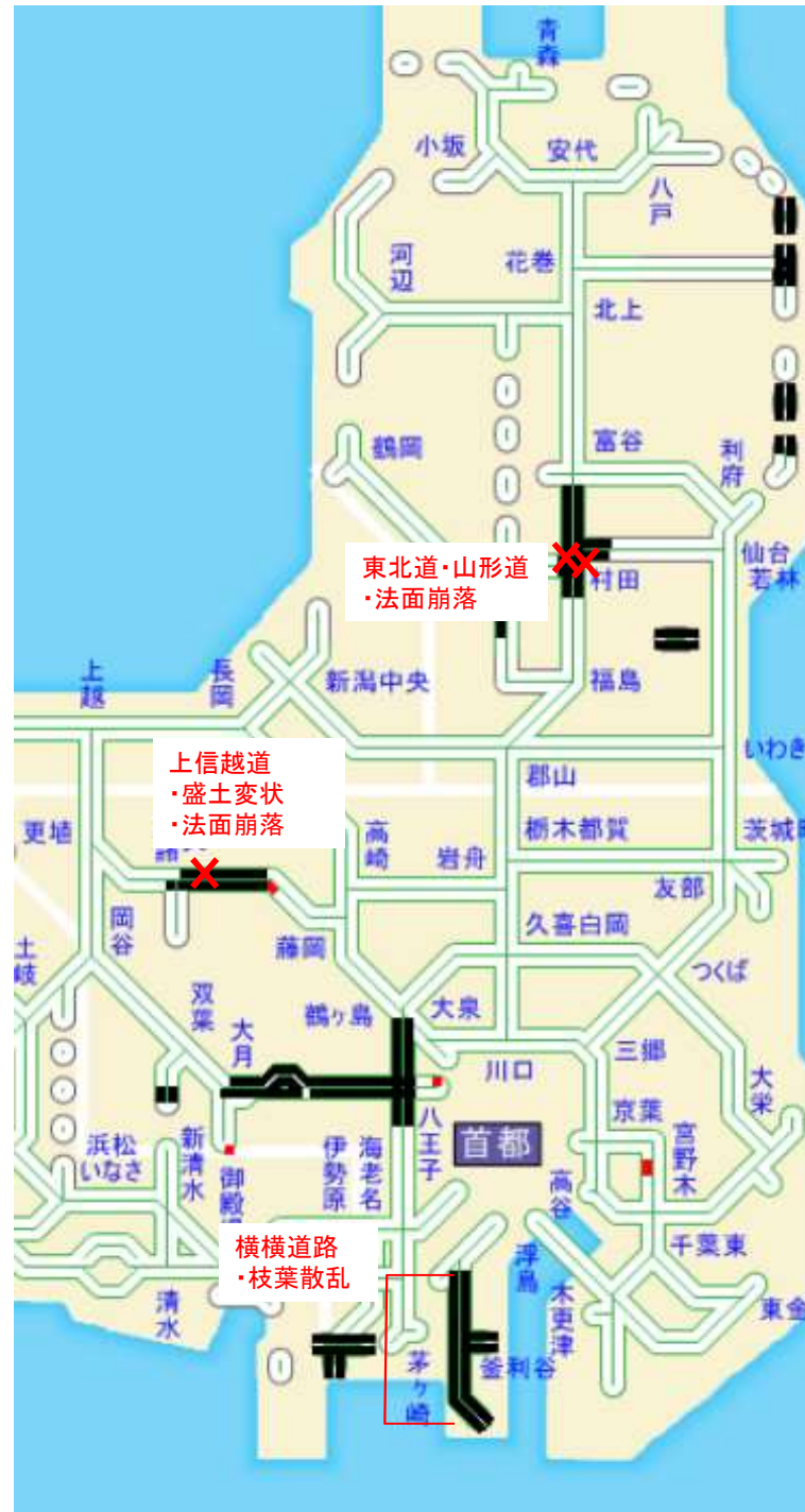
東北道(・山形道): 法面崩落