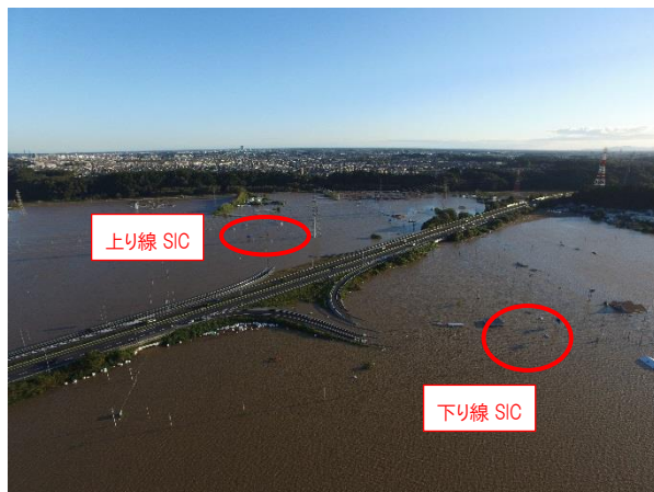
水戸北 SIC 全景