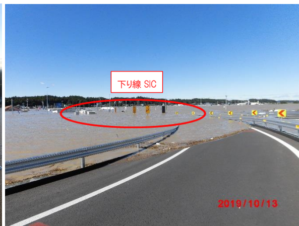
水戸北 SIC 下り線 流出ランプ