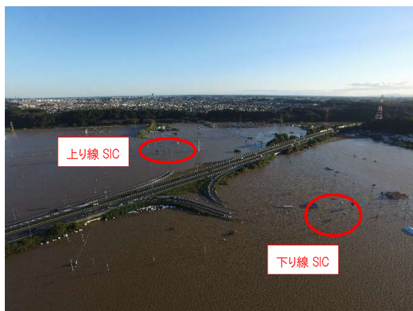
水戸北 SIC 全景