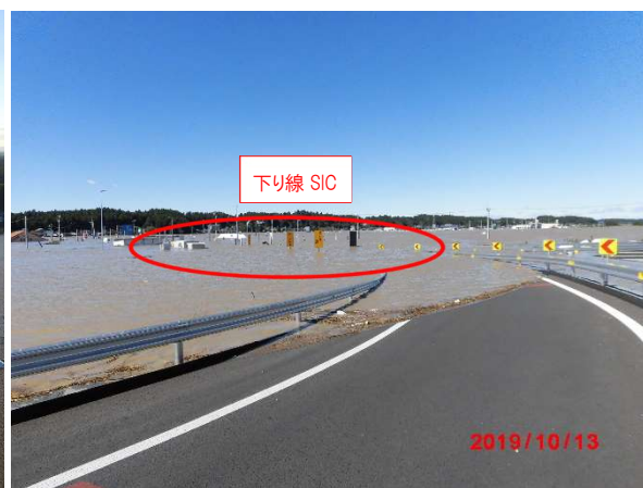
水戸北 SIC 下り線 流出ランプ