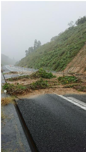
【C4】圏央道 茂原北 IC～茂原長南 IC 間