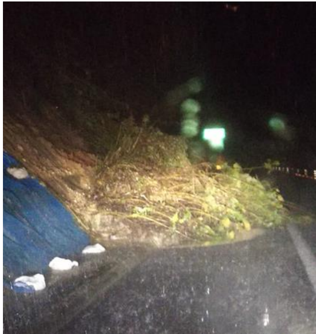
【E6】常磐道 相馬 IC～南相馬 IC 間