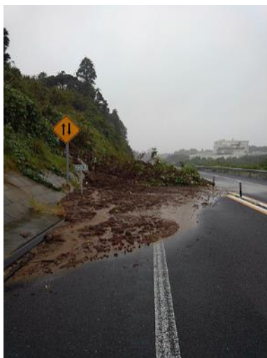
【C4】圏央道 東金 JCT～茂原北 IC 間