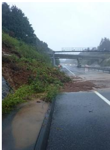
【C4】圏央道 阿見東 IC～稲敷 IC 間