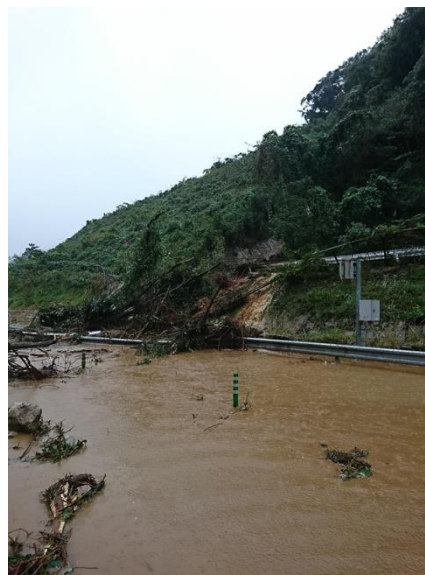
【C4】圏央道 茂原長南 IC～市原鶴舞 IC 間