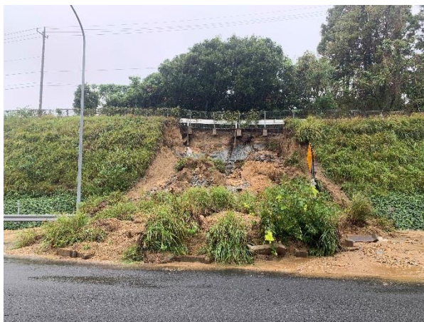
【E51】東関東道 佐倉 IC～酒々井 IC 間