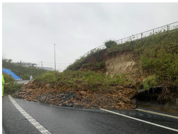
【E51】東関東道 酒々井 IC