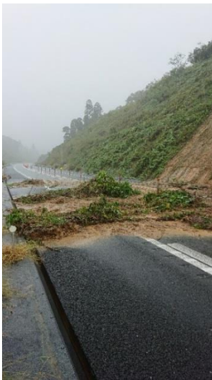
【C4】圏央道 茂原北IC～茂原長南IC間