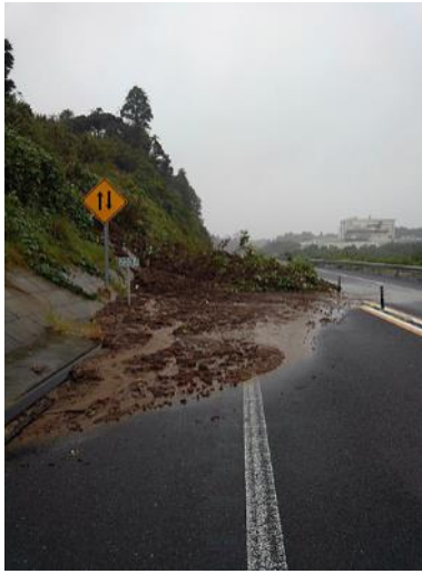
【C4】圏央道 東金 JCT～茂原北 IC 間