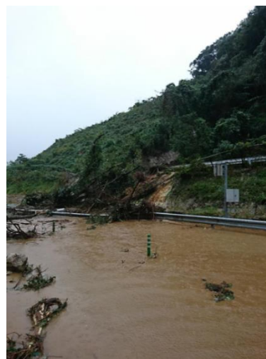
【C4】圏央道 茂原長南IC～市原鶴舞IC間