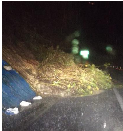
【E6】常磐道 相馬 IC～南相馬 IC 間