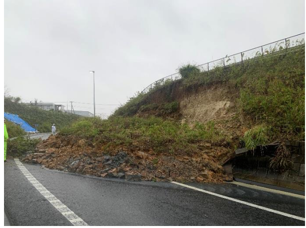
【E51】東関東道 酒々井 IC