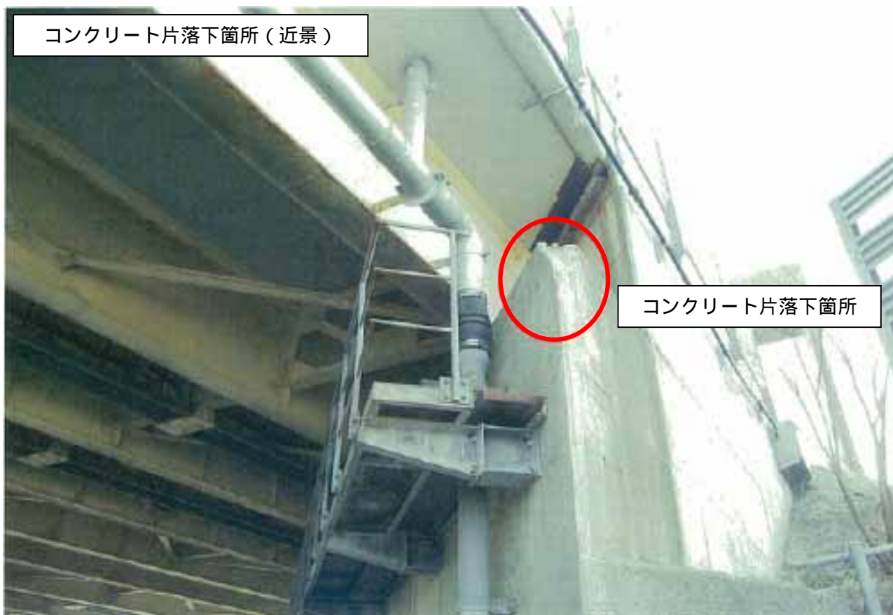
コンクリート片落下箇所