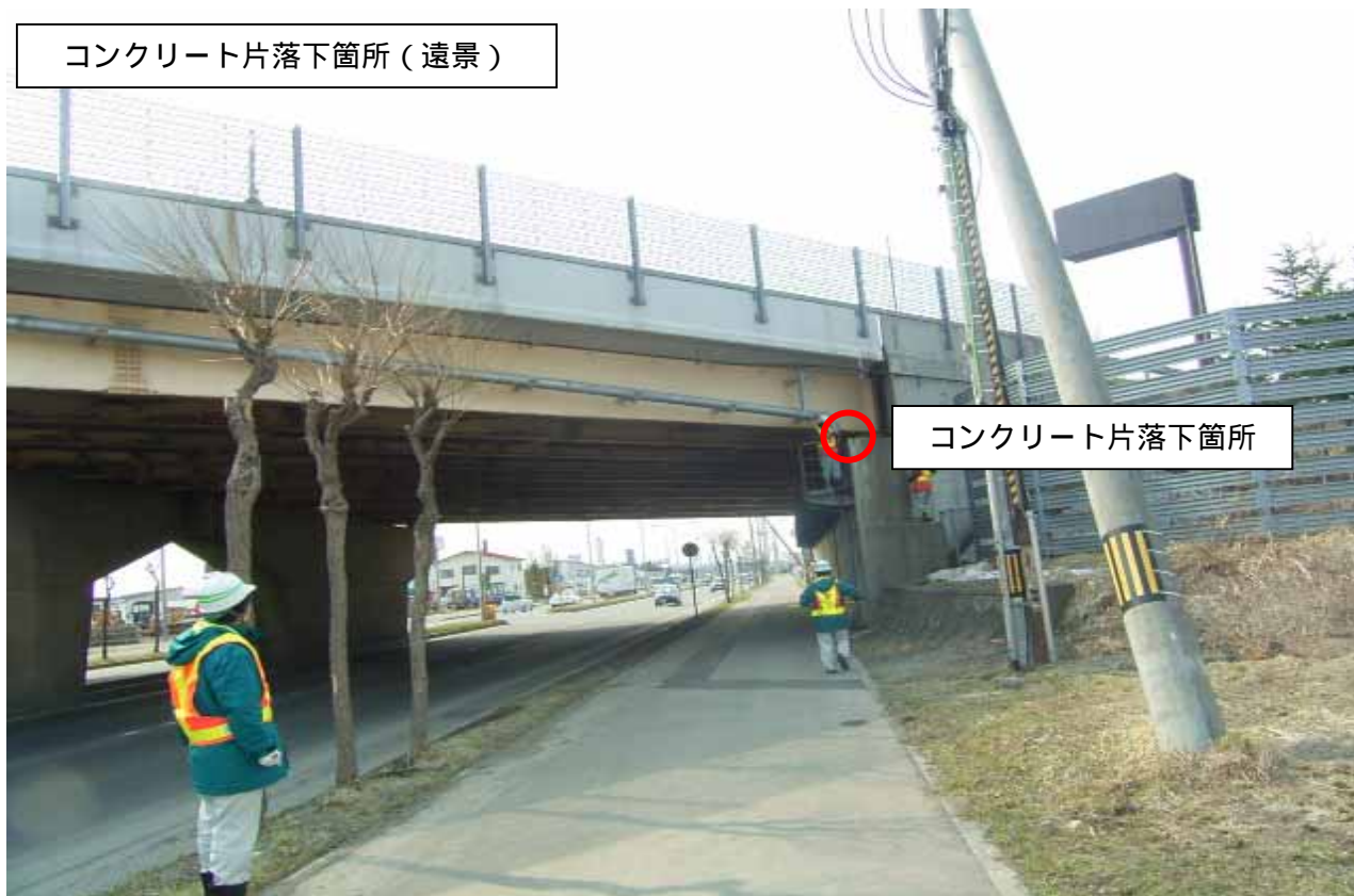
コンクリート片落下箇所