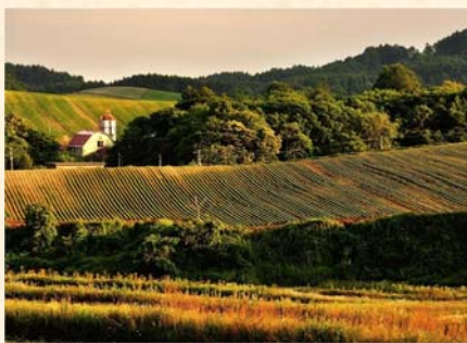
「夕暮れの丘にて」 山内 佳子様（札幌市）「私が写す北海道」部門 【撮影場所：栗沢町（7月撮影）】