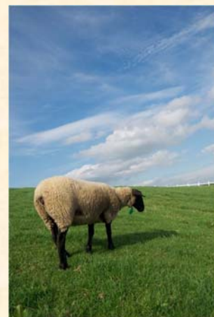
「サフォークの秋」 近藤 和弘様（千歳市）「私が写す北海道」部門 【撮影場所：士別市 羊と雲の丘（8月撮影）】