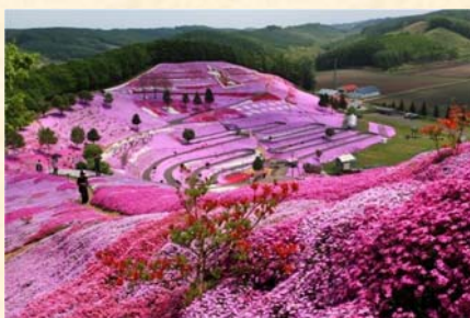
「里山の絨毯」 西原 勝司様（釧路市）「私が写す北海道」部門 【撮影場所：大空町 東藻琴芝桜公園（6月撮影）】