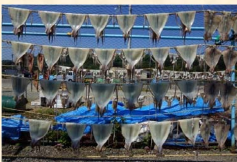
「いか干し」 高野 隆喜様（大阪府）「私が写す北海道」部門 【撮影場所：積丹町（7月撮影）】