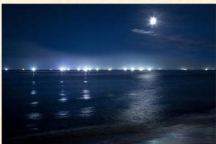
「イカ釣り船のいさり火と満月」 匿名希望様 「私が写す北海道」部門 【撮影場所：函館市 啄木小公園（8月撮影）】