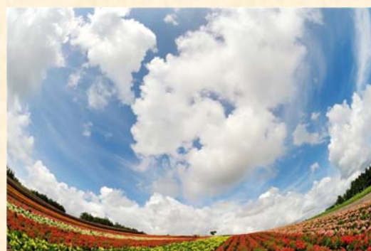
「大空につつまれて」 大森 俊裕様（宮城県）「私が写す北海道」部門 【撮影場所：美瑛町 四季彩の丘（8月撮影）】