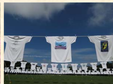
「青い空と白いTシャツ」 竹岡 盛一様（帯広市）「私が写す北海道」部門 【撮影場所：中札内美術村（8月撮影）】