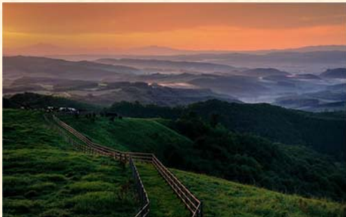
「黎明の牧場に雲海を見る」 大江 平次郎様（北見市）「私が写す北海道」部門 【撮影場所：北見市 本沢牧場（9月撮影）】