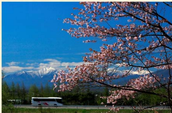
「桜咲く頃」 高田 悦也様（帯広市）「私が写すハイウェイ」部門 【撮影場所：道東道 十勝清水IC～芽室IC間（5月撮影）】