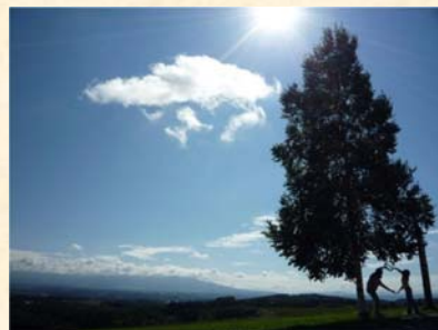
「小さな幸せ」 西田 大輔様（兵庫県）「つながる幸せ」部門 【撮影場所：美瑛町 ジェットコースターの路（8月撮影）】