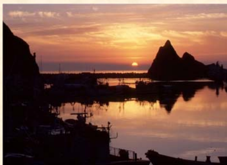
「夕映えのウトロ港」 丹羽 明仁様（愛知県）「私が写す北海道」部門 【撮影場所：斜里町 ウトロ（7月撮影）】