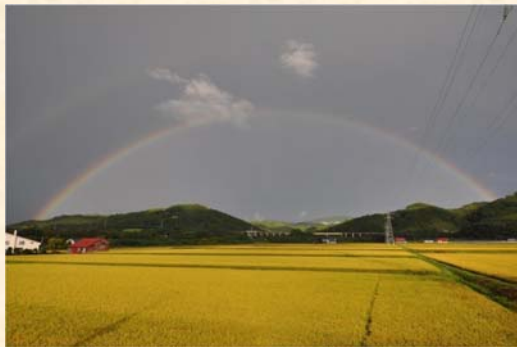
「二重の美虹がかかる高速道」 福本 英之様（旭川市）「私が写すハイウェイ」部門 【撮影場所：道央道 茶志内PA付近（9月撮影）】