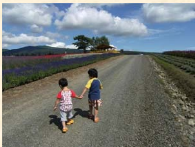
「明日への道」 菊田 龍太郎様（埼玉県）「つながる幸せ」部門 【撮影場所：富良野市（8月撮影）】