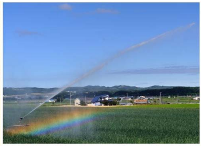
「たまねぎ畑に虹架かる」(7月撮影) 大江 平次郎 様 (北見市) 【撮影場所:北見市】