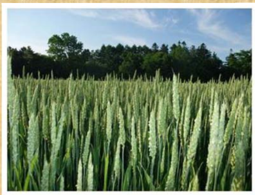
「こむぎだらけ」(7月撮影)