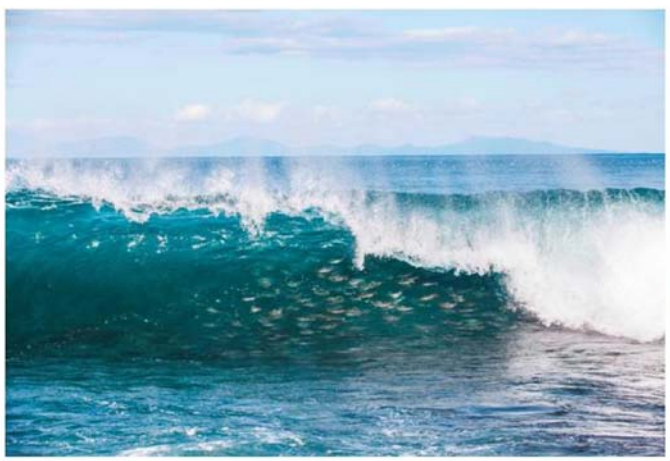
「サケのカーテン」(9月撮影)