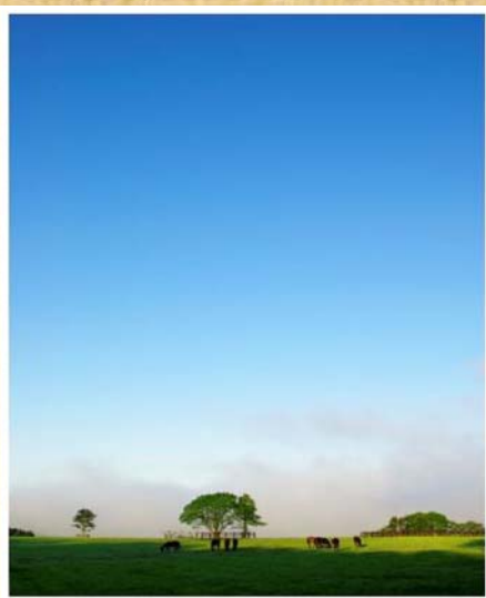
「牧場の朝景」(6月撮影)