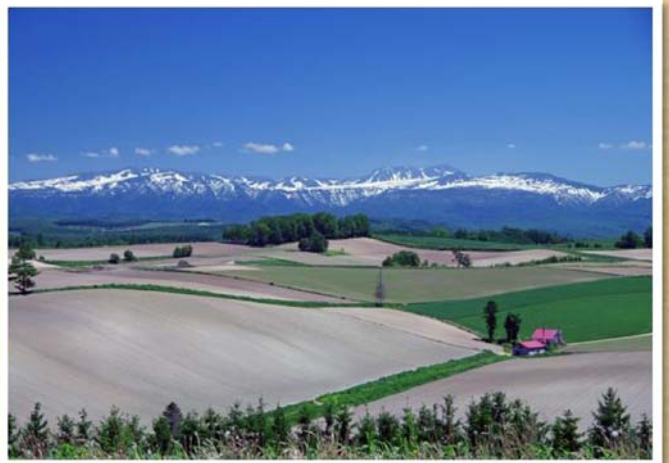
「感動の大地」(6月撮影) 中村 千佳 様 (愛知県) 【撮影場所:美瑛町】