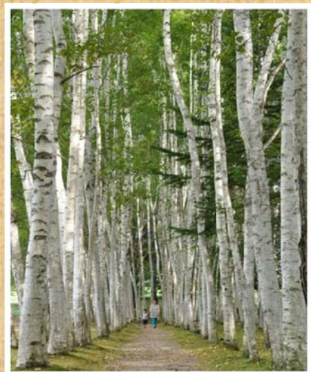
「白樺の散歩道」(9月撮影)