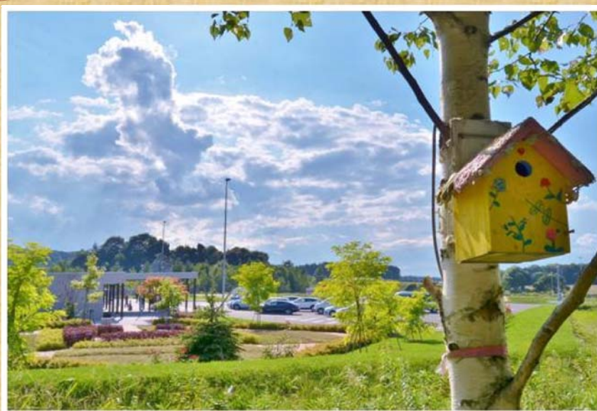
「巣箱のあるパーキング」(9月撮影) 齊藤 修成 様 (苫小牧市) 【撮影場所:道東自動車道 由仁PA】