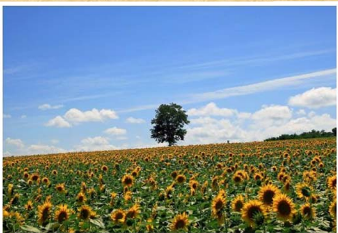
「やっぱ夏っ！」(8月撮影)