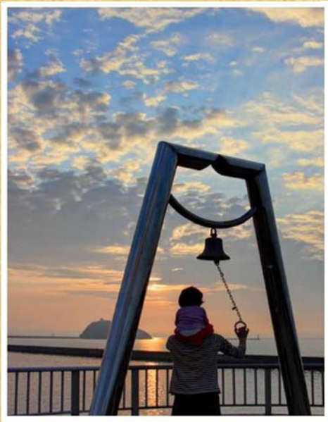
「幸せの鐘」(6月撮影) 中村 敏郎 様 (奈良県) 【撮影場所:室蘭市】