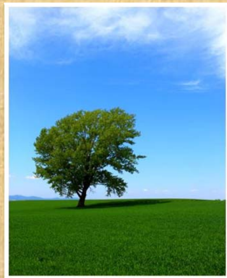
「初夏の草原」(6月撮影)