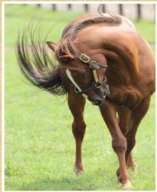
「サラブレッドの夏」(8月撮影)