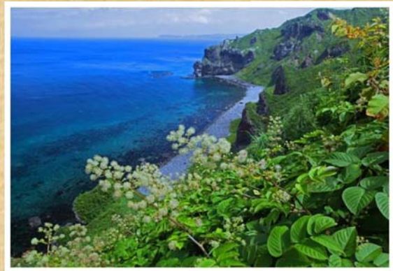
「盛夏の神威岬」(8月撮影)