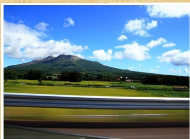
「車窓」(8月撮影) SNOWMAN 様 (札幌市) 【撮影場所:道央自動車道 大沼公園IC～森IC間】