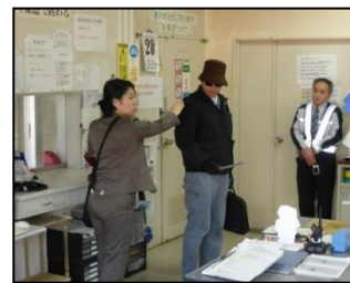
【参考】昨年度実施した様子(白老料金所)