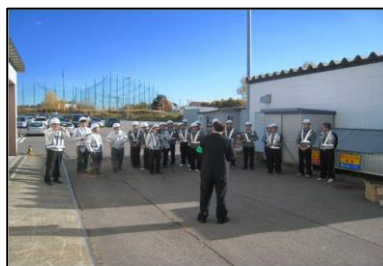
【参考】昨年度実施した様子