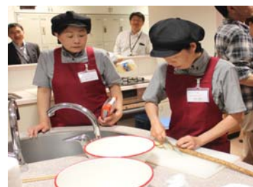
(参考)コンテストの様子