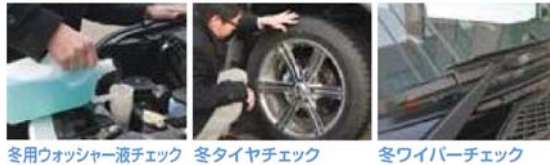
冬用ウォッシャー液チェック 冬タイヤチェック 冬ワイパーチェック

初冬の11月から事故が急増します。特にトンネルの出入口や橋の上などは凍結しやすいので注意が必要です。早めの冬装備を心がけましょう。