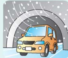
トンネルの出入口