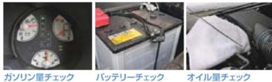
ガソリン量チェック バッテリーチェック オイル量チェック

北海道の高速道路での故障車は年間約5000件。大半がパンク、エンジントラブルです。出発時の点検は忘れずに。