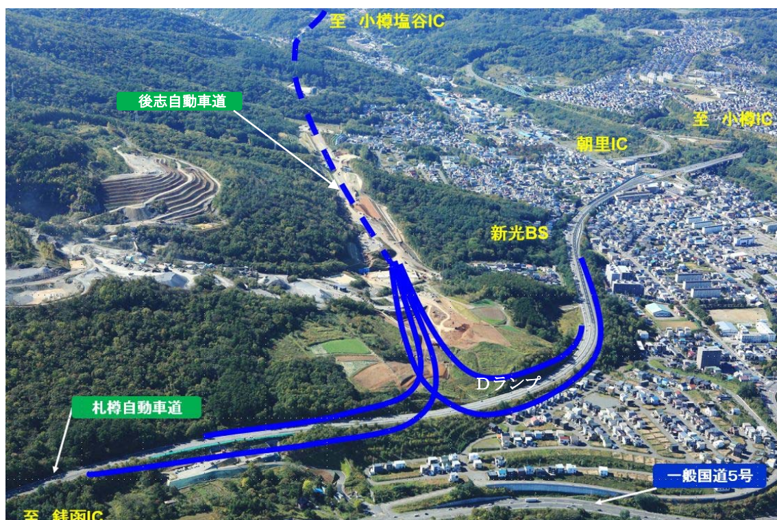
小樽ジャンクション 航空写真(全景)

今回の通行止めは、交通量の少ない時間帯(20時～翌6時まで)とし、加えて曜日については当該時間帯の交通量の多い週末(金・土・日・祝日)を避け、当該時間帯の交通量の少ない平日(月～木)に実施します。